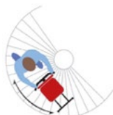
Scala chiocciola Spiral staircase